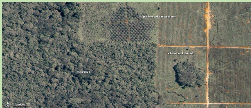
foto: Klčovanie dažďových pralesov kvôli plantážam palmového oleja v Borneu, Malajzia (zdroj: NASA)

No a napokon, sú to environmentálne dôvody. Neustála výroba nových predmetov je možná len vďaka využívaniu prírodných zdrojov – elektriny, vody, ropy, kovov, dreva a mnohých ďalších. Používanie chemikálií pri ťažbe alebo výrobe tiež škodí prírodnému prostrediu a môže spôsobovať zdravotné riziká pre ľudí, ktorí sú do procesu výroby zapojení alebo v takej oblasti žijú.